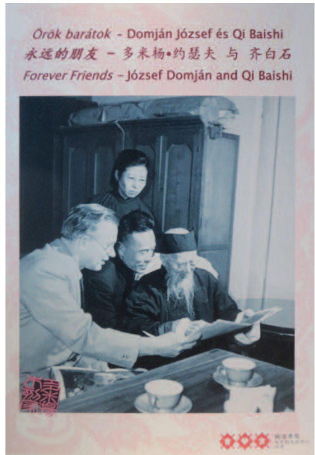
A kiállítás plakátja, amely Qi Baishi és Domján kapcsolatáról ad tanúbizonyságot

A LUPE Magazin 55. számában a Galéria oldalpáron bővebben bemutatottuk Domján József fametszeteit. (A róla szóló írást a www.lupe.hu internetes oldalon a következő linken találják meg: http://lupe.hu/images/lupe_galeria/55_domjan.pdf ).